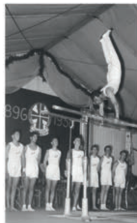
Hier am Barren 1956