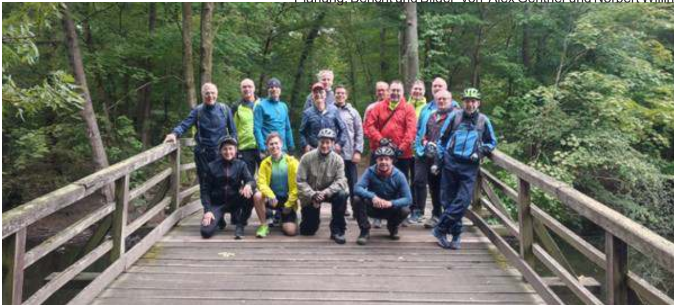
Kurzer Stopp im Frankfurter Stadtwald am Jacobiweiher

Planung, Bericht und Bilder von Alex Gentner und Norbert Willin